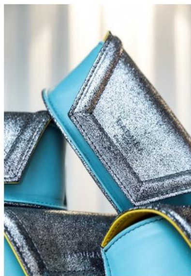
I porta-occhiali della collezione realizzata da Badura e Adisco