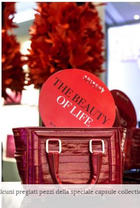
Alcuni pregiati pezzi della speciale capsule collection