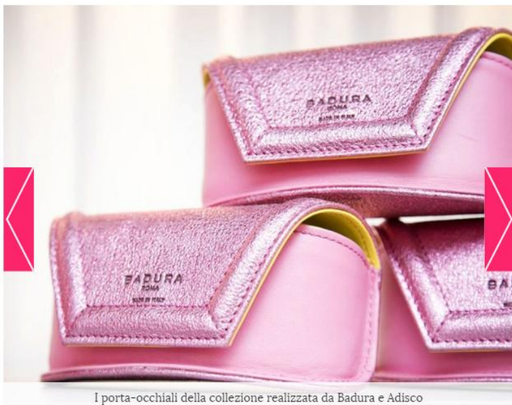
I porta-occhiali della collezione realizzata da Badura e Adisco