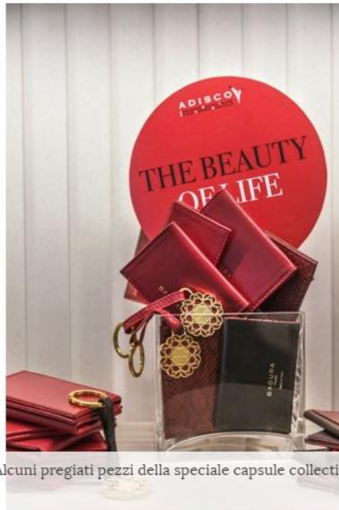
Alcuni pregiati pezzi della speciale capsules collection